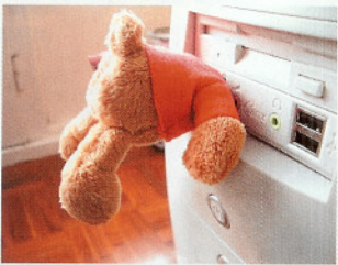
◆使用中は、ハチミツを求めて木の穴に頭を突っ込んだように見えるので、わりと可愛い。メモリ本体はトランセンド製だとか。