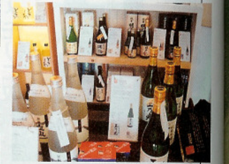
◆日本酒にはお店のオリジナルの説明書きが!