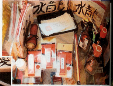
◆書道用具セットは、毛筆に墨汁、硯、文鎮などなど。かなり本格派の品ぞろえ。