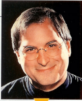
かつてのジョブズ氏