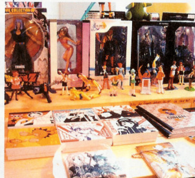
◆住所: Hubertusstraße 8 A・12163 Berlin. 地下鉄U8線Schloßstr. 駅下車徒歩2分。